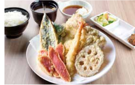
博多天定食 ¥2,600 (2,364) 明太天・明太しゅうまい天・海老1尾 ・豚肉・おすすめ魚介1種 ・おすすめ野菜3種・こしあんこ天