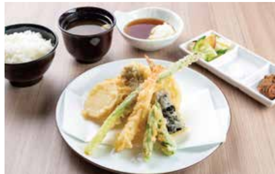
季節野菜天定食 ¥1,600 (1,455) 海老1尾・定番野菜3種・季節野菜3種