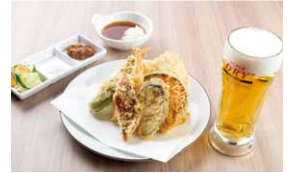
選べるアルコールセット ¥1,880 (1,709) 魚介3種・豚肉・野菜3種 アルコールは下記より1つお選び下さい ・アサヒ生 ・ハイボール ・ワンカップ酒 ・芋焼酎 ・サワー各種 ・ワンカップワイン