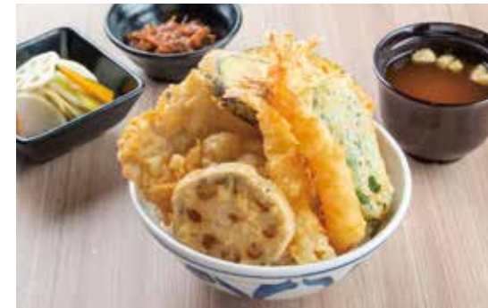
たかお天井 ¥1,550 (1,409) 海老2尾・豚肉・野菜4種