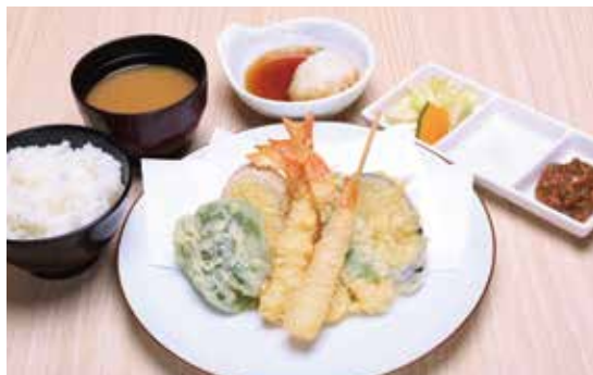
海老海老天定食 ¥1,800 (1,636) 海老2尾・海老カダイフ巻 ・海老大葉巻・野菜3種