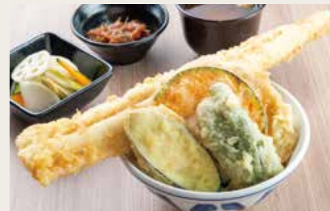
⑪O-anago Tendon ¥3,200

Sardine×2, Chicken breast meat, Vegetables×4 沙丁鱼(两片)、鸡肉、四种蔬菜 정어리×2, 닭고기, 야채×4