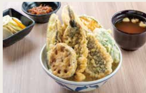
⑩Sardine Tendon ¥1,500

Shrimp×2, Pork, Vegetables×4 大虾(两尾)、猪肉、四种蔬菜 새우×2, 돼지고기, 야채×4