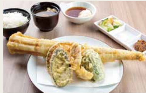
⑥O-anago Tempura Teishoku ¥3,200

Pork, Shrimp×2, Seasonal Seafoods×2, Seasonal Vegetables×3, Sweet bean paste 猪肉、大虾(两尾)、两种季节海鲜、三种季节蔬菜、红豆沙 돼지고기, 새우×2, 야채해물×2, 계절야채×3, 고시엔