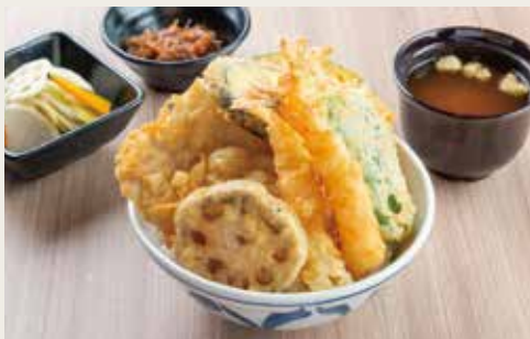
⑨Takao Tendon ¥1,550

Shrimp×2, Pork, Vegetables×4 大虾(两尾)、猪肉、四种蔬菜 새우×2, 돼지고기, 야채×4