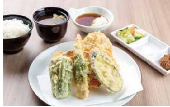
肉天定食 ¥1,480 (1,345) 豚肉・ささみ大葉巻・鶏肉2ヶ ・野菜3種