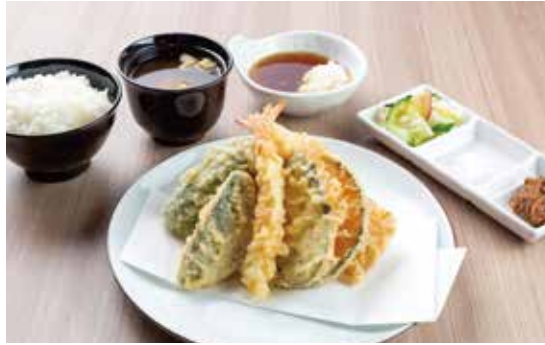
たかお天定食 ¥1,480 (1,345) 豚肉・海老・魚介2種・野菜3種