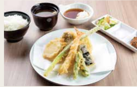
③Seasonal Vegetables Tempura Teishoku ¥1,600

Pork, Chicken breast shiso winding, Chicken×2, Vegetables×3 猪肉、鸡胸肉紫苏卷、鸡肉(两片)、三种蔬菜 돼지고기, 닭가슴살 시소 감쌌, 닭고기×2, 야채×3