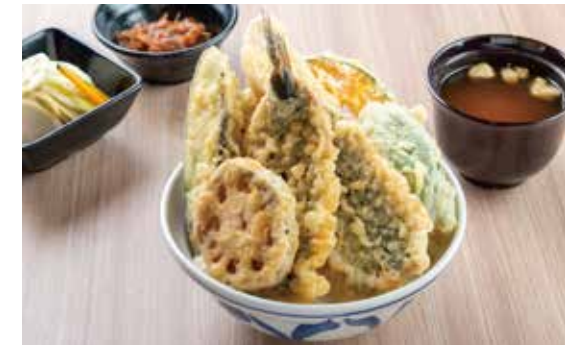
国産いわし天井 ¥1,500 (1,364) 国産いわし2枚・ささみ・野菜4種