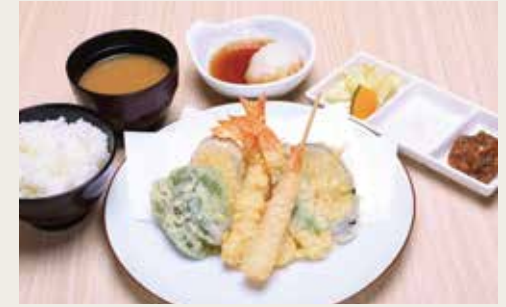
④Shrimp Tempura Teishoku ¥1,800

Shrimp×2, Shrimp wrapped in shiso, Shrimp wrapped in kadaifi pastry, Vegetables×3 大虾(两尾)、紫苏叶包裹的虾仁、炸虾包、三种蔬菜 새우×4, 새우쌌말쌌이, 새우튀김, 야채×3