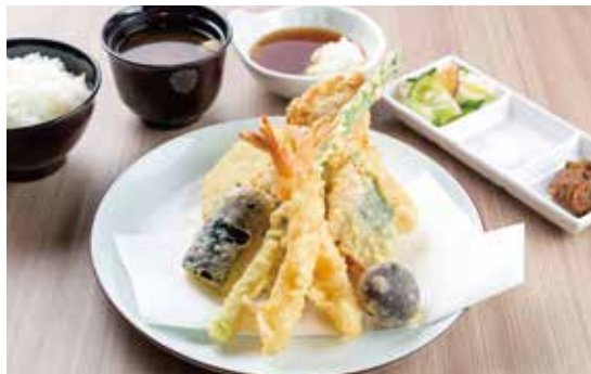
上たかお定食 ¥2,100 (1,909) 豚肉・海老2尾・旬の魚介1種・ おすすめ魚介1種・季節野菜3種・こしあんこ天