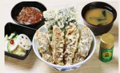
⑫Roasted eel Tendon ¥2,680

Conger eel(whole), Chicken breast meat, Vegetables×3 大星鰻鱼(一条)、鸡脯肉、三种蔬菜 봉장어1마리, 닭가슴살, 야채×3