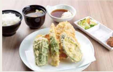
②Meat Tempura Teishoku ¥1,480

Pork, Fish, Shrimp, Squid, Vegetables×3 猪肉、鱼、大虾、墨鱼、三种蔬菜 돼지고기, 생선, 새우, 오징어, 야채×3