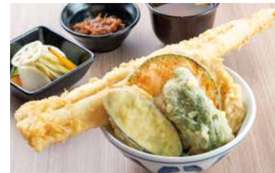
国産活〆大穴子天井 ¥3,200 (2,909) 国産活〆大穴子1尾・ささみ・野菜3種