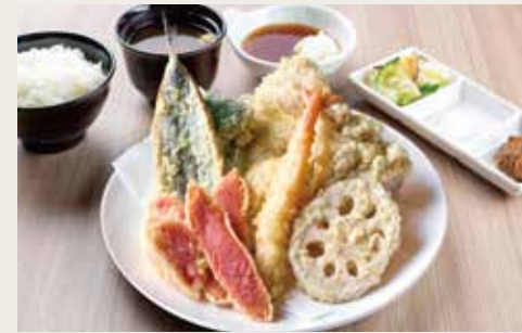
⑦Hakata Tempura Teishoku ¥2,600

Conger eel(whole), Chicken breast meat, Vegetables×3 大星鰻鱼(一条)、鸡脯肉、三种蔬菜 봉장어1마리, 닭가슴살, 야채×3