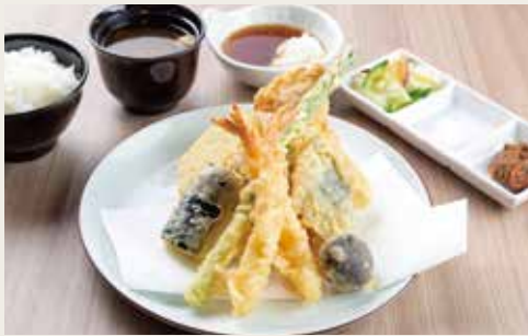
⑤Special Takao Tempura Teishoku ¥2,100

Shrimp×2, Shrimp wrapped in shiso, Shrimp wrapped in kadaifi pastry, Vegetables×3 大虾(两尾)、紫苏叶包裹的虾仁、炸虾包、三种蔬菜 새우×4, 새우쌌말쌌이, 새우튀김, 야채×3