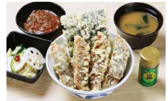
うなぎ蒲焼天井 ¥2,680 (2,436) うなぎ蒲焼天4枚・国産海苔天

*表示の価格は税込(税抜)です。 *写真はイメージです。 *ピーク時はお一人様一つ定食、セット、丼のいずれかの注文をお願い致します。 *定食・丼ものの野菜は時期によりきのこ類を含みます。 *仕入状況により一部提供出来ない商品がある場合もございます。