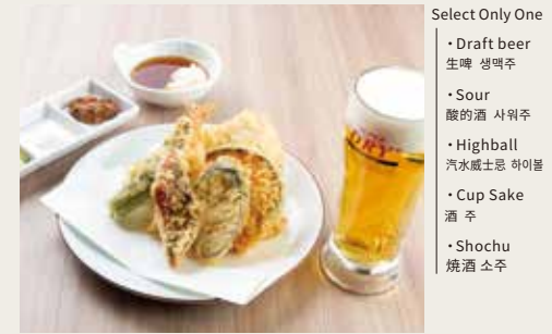
⑧Select Alcohol Set ¥1,880

Spicy fish eggs, Spicy fish eggs dumpling, Pork, Shrimp, Seafood, Seasonal Vegetables×3, Sweet bean paste 明太子天妇罗、明太子饺子、猪肉、大虾、海鲜、三种季节蔬菜、红豆沙 명太子, 명太子만두, 돼지고기, 새우, 해물, 계절야채×3, 고시엔