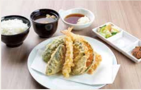
①Takao Teishoku ¥1,480

Pork, Fish, Shrimp, Squid, Vegetables×3 猪肉、鱼、大虾、墨鱼、三种蔬菜 돼지고기, 생선, 새우, 오징어, 야채×3