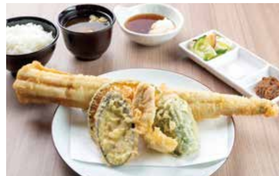
国産活〆大穴子定食 ¥3,200 (2,909) 国産活〆大穴子1本・ささみ・野菜3種