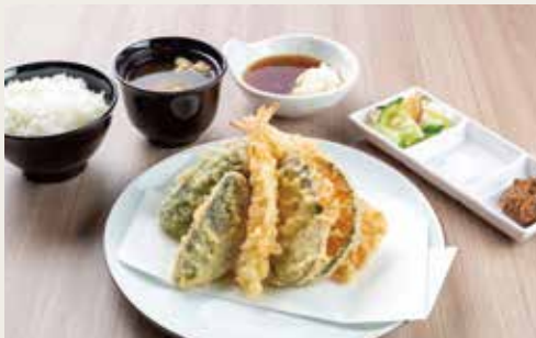
① Takao Teishoku ¥1,380

Pork, Shrimp, Seafoods×2, Vegetables×3 猪肉、大虾、二种海鲜、三种蔬菜 돼지고기, 새우, 해산물×2, 야채×3