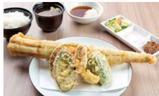
国産活大穴子天定食 ¥3,200 国産活大穴子1本・ささみ・野菜3種 (2,909)