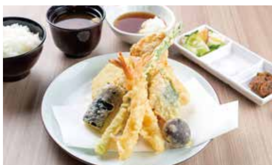
上たかお天定食 ¥2,100 豚肉・海老2尾・旬の魚介1種・おすすめ魚介1種・季節野菜3種・こしあんこ天 (1,909)