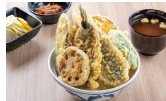
国産いわし天井 ¥1,500 (1,364) 国産いわし2枚・ささみ・野菜4種