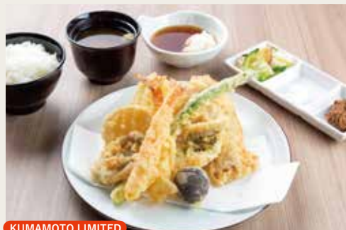
⑥ Kumamoto Tempura Teishoku ¥2,180

Pork, Shrimp×2, Seafoods×2, Seasonal Vegetables×3, Sweet bean paste 猪肉、大虾(两尾)、两种海鲜、三种季节蔬菜、豆瓣酱 돼지고기, 새우×2, 해물×2, 계절야채×3, 떡