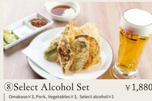
⑧ Select Alcohol Set ¥1,880

Conger eel(whole), Chicken breast meat, Vegetables×3 大星鰻魚(一条)、鸡脯肉、三种蔬菜 봉장어1마리, 닭가슴살, 야채×3