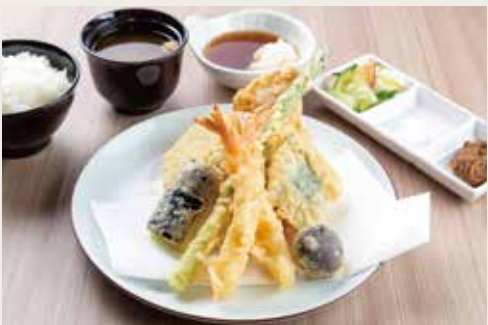
⑤ Special Takao Teishoku ¥2,100

Shrimp×2, Shrimp wrapped in shiso, Shrimp wrapped in kadaif pastry, Vegetables×3 大虾(两尾)、紫苏叶包裹的虾仁、炸虾包、三种蔬菜 새우×4, 새우갸릿말이, 새우튀김, 야채×3