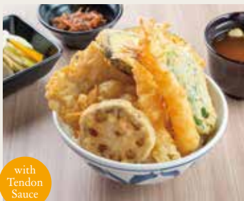
⑨ Takao Tendon ¥1,550

Omakase×3, Pork, Vegetables×3, Select alcohol×1 三种交给你、猪肉、三种蔬菜、酒 오마카세×3, 돼지고기, 야채×3, 술 ..... Select Only One ..... • Draft beer 生啤 생맥주 • Highball 汽水威士忌 하이볼 • Sake 酒 주 • Cup wine 葡萄酒 와인 • Sour 酸的酒 사워주 • Shochu 烧酒 소주