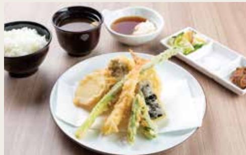
③ Seasonal Vegetables Teishoku ¥1,600

Pork, Chicken breast shiso winding, Chicken×2, Vegetables×3 猪肉、鸡胸肉紫苏卷、鸡肉(两片)、三种蔬菜 돼지고기, 닭가슴살 시소김밥, 닭고기×2, 야채×3