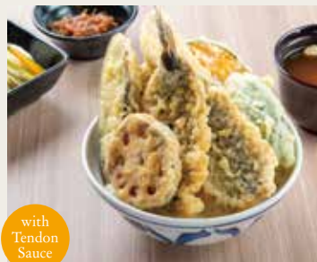
⑪ Sardine Tendon ¥1,500

Pork×2, Chicken breast shiso winding, Vegetables×4 猪肉(两片)、鸡胸肉紫苏卷、四种蔬菜 돼지고기×2, 닭가슴살 시소김밥, 야채×4