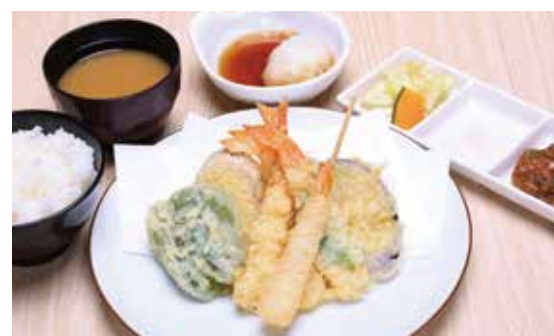
海老海老天定食 ¥1,800 海老2尾・海老カダイフ巻・海老大葉巻・野菜3種 (1,636)