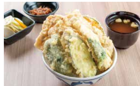
肉天井 ¥1,500 (1,364) 豚肉2ヶ・ささみ大葉巻・野菜4種