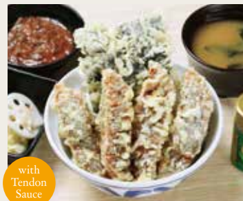
⑬ Roasted eel Tendon ¥2,680

Shrimp×5, Pork, Vegetables×2 大蝦(五只)、猪肉、二種蔬菜 새우×5, 돼지고기, 야채×2