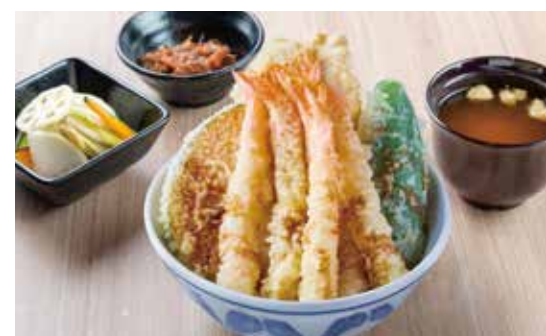
海老海老天井 ¥2,200 (2,000) 海老5尾・豚肉・野菜2種