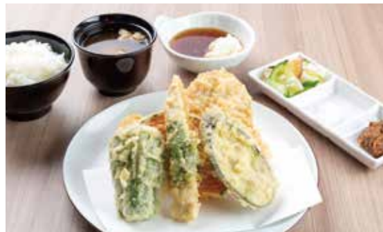
肉天定食 ¥1,380 豚肉・ささみ大葉巻・鶏肉2ヶ・野菜3種 (1,255)