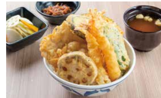
たかお天井 ¥1,550 (1,409) 海老2尾・豚肉・野菜4種