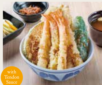
⑫ Shrimp Tendon ¥2,200

Sardine×2, Chicken breast meat, Vegetables×4 沙丁魚(两片)、鸡肉、四种蔬菜 정어리×2, 닭고기, 야채×4