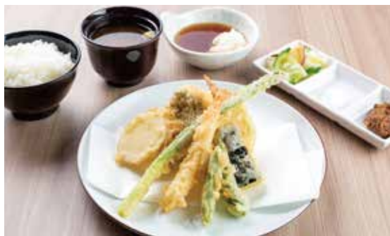
季節野菜天定食 ¥1,600 海老1尾・定番野菜3種・季節野菜3種 (1,455)