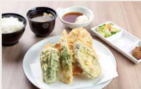
② Meat Tempura Teishoku ¥1,380

Pork, Shrimp, Seafoods×2, Vegetables×3 猪肉、大虾、二种海鲜、三种蔬菜 돼지고기, 새우, 해산물×2, 야채×3