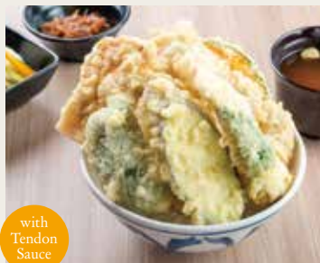
⑩ Meat Tendon ¥1,500

Shrimp×2, Pork, Vegetables×4 大虾(两尾)、猪肉、四种蔬菜 새우×2, 돼지고기, 야채×4