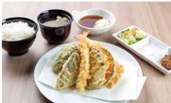
たかお天定食 ¥1,380 豚肉・海老・魚介2種・野菜3種 (1,255)