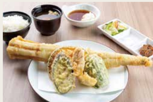
⑦ O-anago Tempura Teishoku ¥3,200

Local chicken, Shrimp, Seafood, Mustard lotus root, Seasonal Vegetables×3, Delicacy sweet bean paste 本地雞、大虾、海鮮、榨菜蓮藕、三种季节蔬菜、美味红豆沙 토종닭, 새우, 해물, 맥운 연근, 계절야채×3, 심세고시안