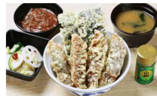
うなぎ蒲焼天井 ¥2,680 (2,436) うなぎ蒲焼天4枚・国産海苔天