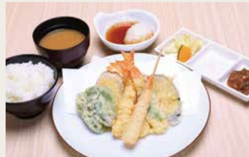
④ Shrimp Tempura Teishoku ¥1,800

Shrimp, Seasonal Vegetables×3, Vegetables×3 大虾、三种季节蔬菜、三种蔬菜 새우, 계절야채×3, 야채×3